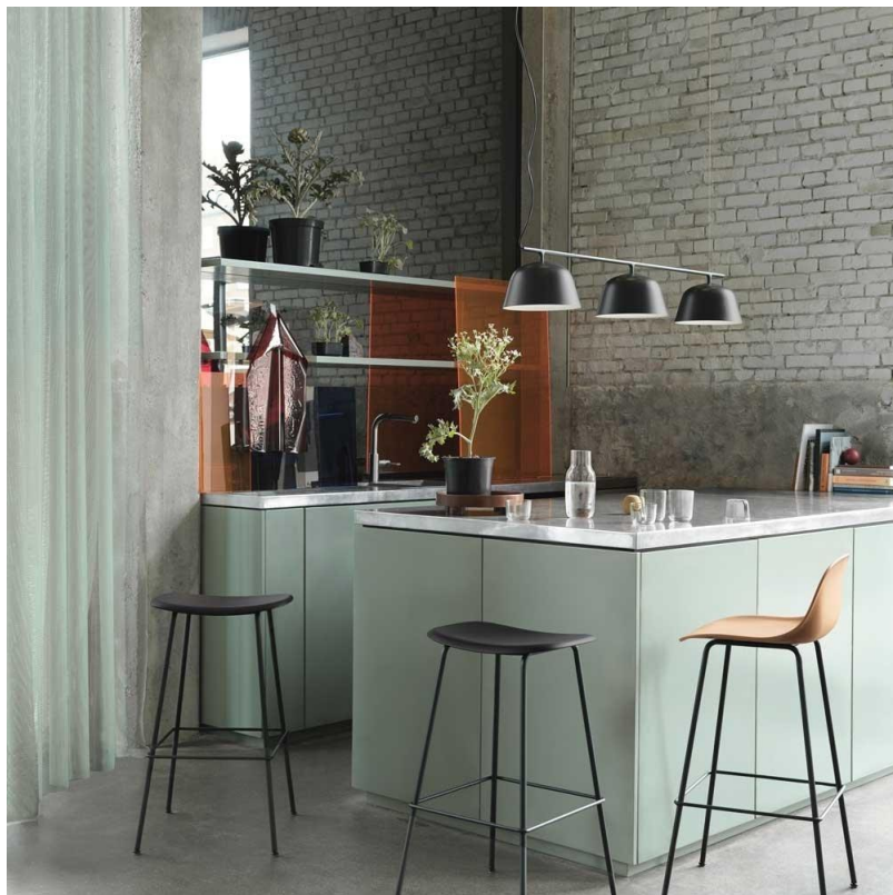
Suspension Ambit Rail Muuto

Par ailleurs, il est de même concernant le vert sauge . Une délicate combinaison entre le vert gris et vert céladon, le vert sauge constitue l'un des plus naturels. Ce dernier apporte plus d'authenticité à votre intérieur. Associé à des poutres apparentes en bois brut, le vert accentuera l'effet nature, rustique et champêtre.