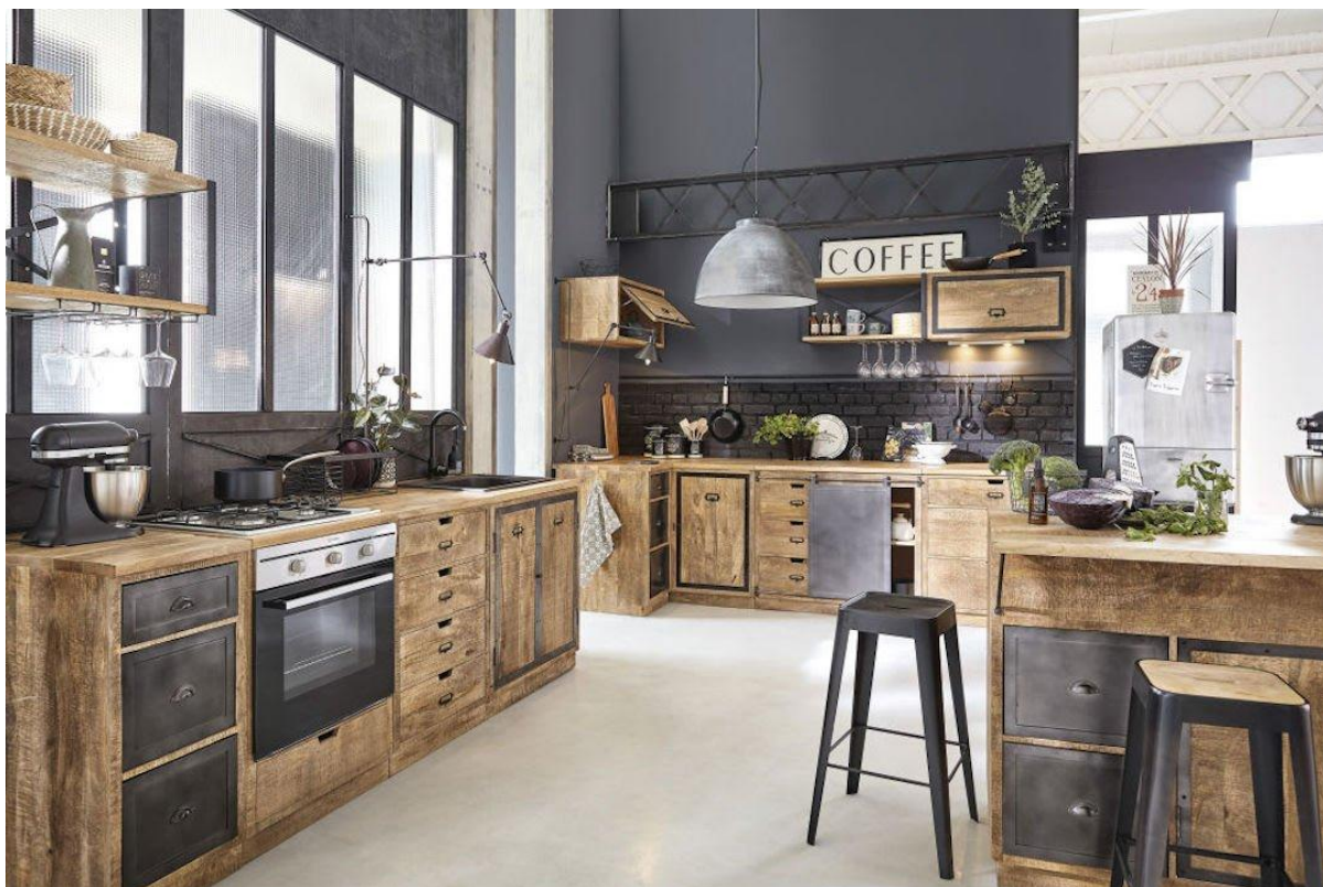
Jean-Marc Palisse // Melchior Maisons du Monde

Enfin, peaufinez l'allure de votre déco en apportant de la modernité en travaillant les finitions. Par exemple, l'ajout de robinets à fini blanc mat, noir mat ou bien en laiton feront leur petit effet vous verrez.