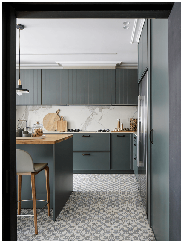
Alvhem // Appartement d' Eixample

Ajoutez des notes contemporaines à votre intérieur