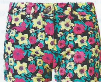
Short en coton, 23 €, Twintip, sur Zalando.fr