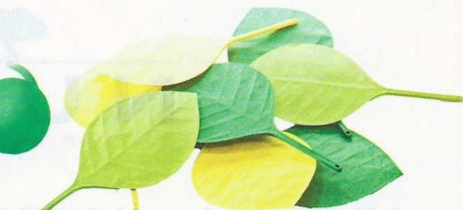
Éventails en papier et plastique, 18 x 0,8 x 36 cm, 15 € l'un, Pa-design.com