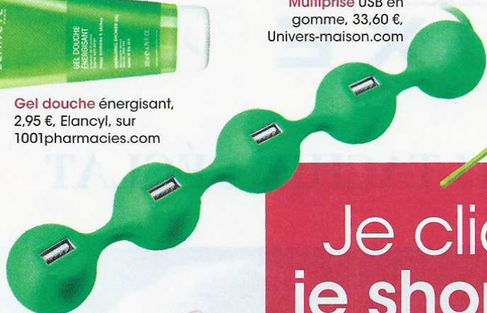
Multiprise USB en gomme, 33,60 €, Univers-maison.com