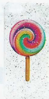
Coque pour iPhone 5 en PVC, 14 €, Asos.fr