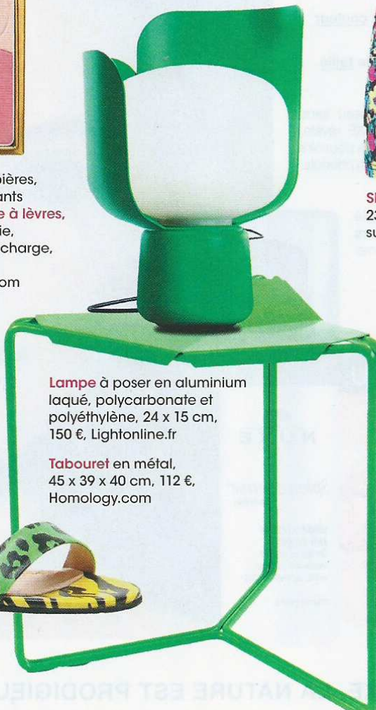
Lampe à poser en aluminium laqué, polycarbonate et polyéthylène, 24 x 15 cm, 150 €, Lightonline.fr