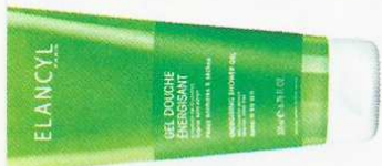
Gel douche énergisant, 2,95 €, Elancyl, sur 1001pharmacies.com