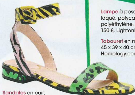
Sandaes en cuir, 215 €, Moschino Cheap and Chic, sur Sarenza.com